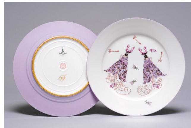
Françoise Quardon , Le Délice des harpies , 2009 – Service en porcelaine de la Manufacture nationale de Sèvres Assiette plate (gibier), diam 25 cm Collection de l'artiste