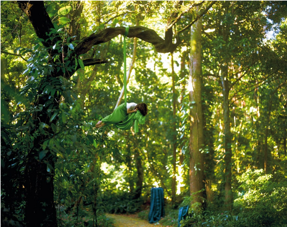
Janaina Tschäpe , Pendulus Somnis , 2005 – Glossy C-print 103,5 x 153,5 cm Edition 3/6