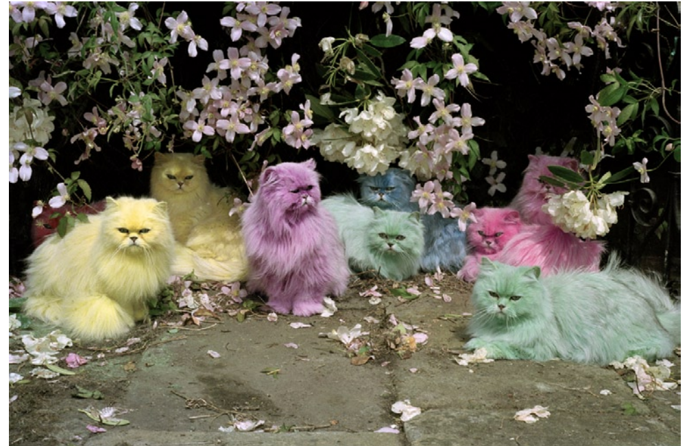
Tim Walker , Pastel Cats , 1998 – Photographie couleur 83 x 70 cm